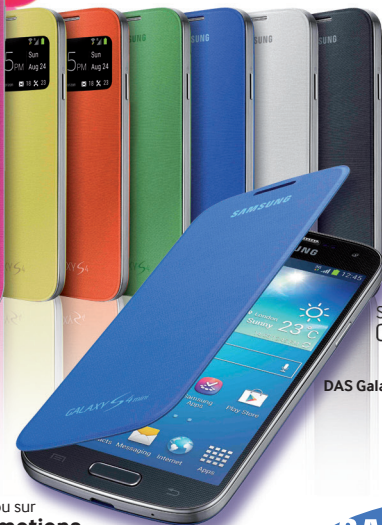
Samsung GALAXY S4 mini